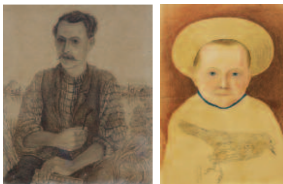
Adolf Dietrich, Autoportrait avec accordéon / Selbstbildnis mit Handorgel, 1906 Portrait de garçon / Knabenportrait, 1909